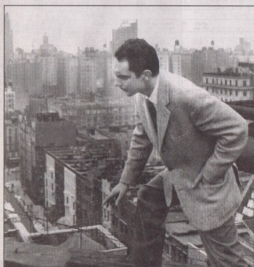
Un'immagine "aerea" di Italo Calvino

Eppure, nonostante le omissioni (tra cui l'incontro a Parigi tra il fratello Biagio, io narante del romanzo, e Voltaire «cocolato da uno stuolo di madame, allegro come una pasqua e maligno